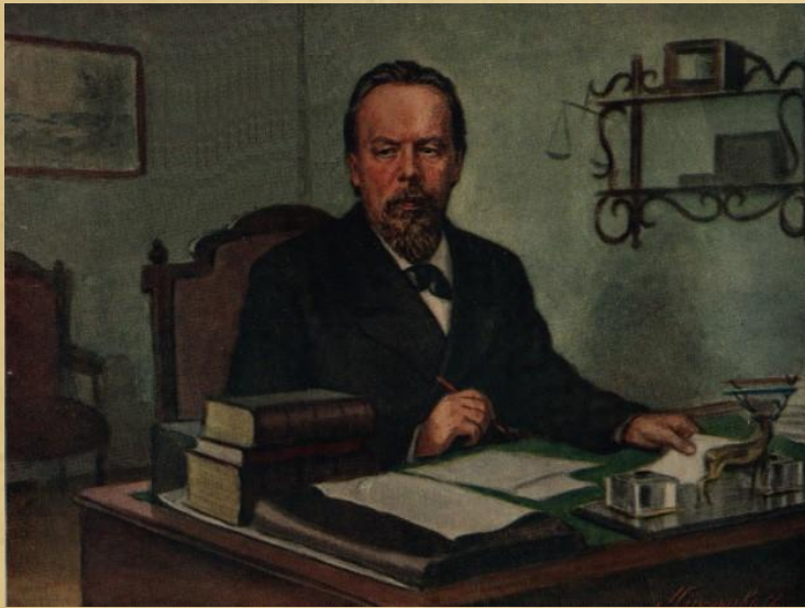
Александр Степанович Попов